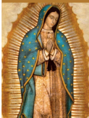
Nossa Senhora de Guadalupe

TEMA: “Amar a Jesus com o mesmo amor de Maria”.